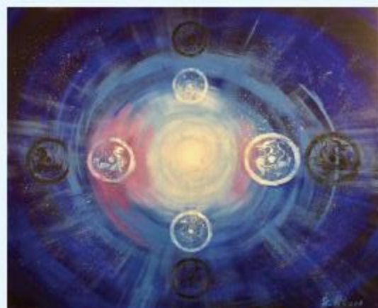
作者：上海视觉艺术学院美术学院 朱刚

1、《宙》作品简介：宙，古往今来之时间。宇宙万物，浩荡不竭。日月、雷电、风雨、四季，晨钟暮鼓，无限循环，太极、两仪、四象、八卦，源远流长，绵延至今。此乃生命赖以生存，世间万事万物生生不息之道也。斯道者，如江河行地，纵传于世。先贤始创日晷，观时述变，以日影随动摄经行其内，诚巧思也。又有后学绍继其妙，精研职志，逆时辰推衍，尚动静其幻，来轸方道！天地山河之流转，人间世事之变迁，尽归于宙，乃此画之魂也。