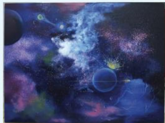
作者：灯彩集团 刘嘉伟

3、《时间反演·星恒》作品简介：本作品主要表达的是时间反演对称性，非镜像对称性。宇宙中星体都有某个对应的另一个星体，只不过可能大小颜色有所区分。画面中有一道光越过星体，仿佛整个空间就静止了，如果可能有一种物质能够超越这道光那么就会引发一系列的变化，就能穿梭过去未来。那么某些星体就产生某种联系，如星体可能作为时间的承载者，慢慢演变为“粒子”。而粒子传递着无限的信息。